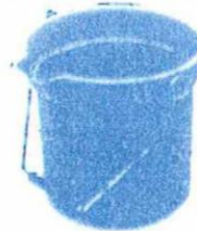
吟醸米計量バケツ (別売り)