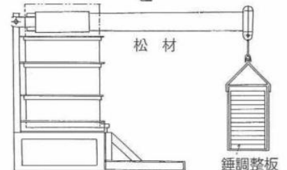
手廻式吟醸搾り機